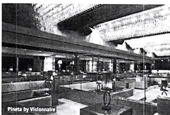
Pineta by Visionnaire