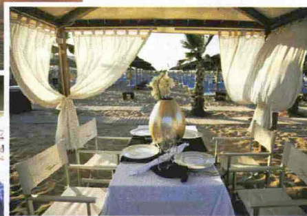
Dall'alto in senso orario: Samsara Lounge Beach, Gallipoli; Tourquoise di Rimini; Villapapeete, Milano Marittima